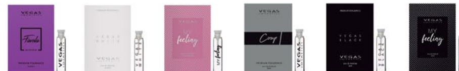
CAMPIONCINO | 2ML | COD. 9051 | 1,50€ FAVOLA COUP VEGAS WHITE VEGAS BLACK MY FEELING WOMAN MY FEELING MAN

(Aggiungi il codice della fragranza desiderata al codice del prodotto)