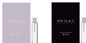
CAMPIONCINO | 2ML | COD. 9051 | 1,50€ WOMAN MAN