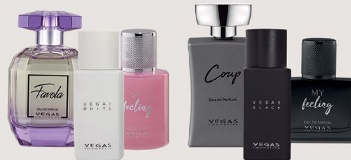
PER LEI PER LUI FAVOLA | 100ML | COD. 130 | 43,50€ VEGAS WHITE | 50ML | COD. 140 | 35,00€ MY FEELING WOMAN | 50ML | COD. 134 | 35,00€ COUP | 100ML | COD. 131 | 43,50€ VEGAS BLACK | 50ML | COD. 139 | 35,00€ MY FEELING MAN | 50ML | COD. 135 | 35,00€

Il tocco sottile delle fragranze Premium, combinato con il potente senso dell'olfatto, ha la capacità di creare magici momenti che rimangono indelebili e di rendere la vita più completa.