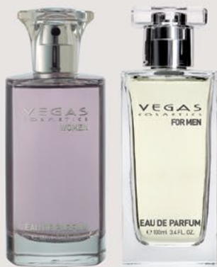
PER LEI PER LUI 100ML | COD. 100 | 32,00€

Il profumo Vegas lascia un segno personale praticamente indimenticabile. Con le sue note piacevoli, coinvolge tutti i sensi.